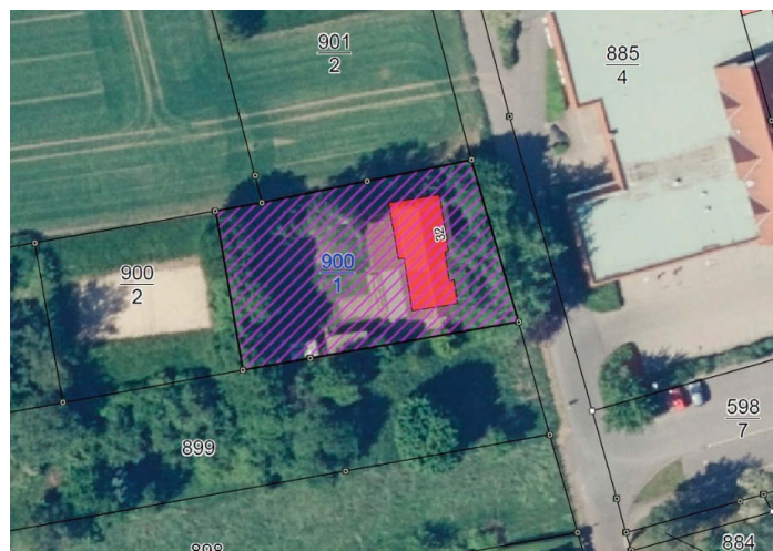
Lageplan Am alten Wasserwerk 32 (Jugendclub Mügeln)

Die Stadt Mügeln verkauft als Eigentümerin nachfolgende Grundstücke in der Gemarkung Mügeln: